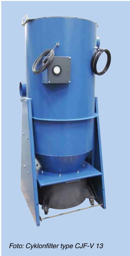
Foto: Cyklonfilter type CJF-V 13